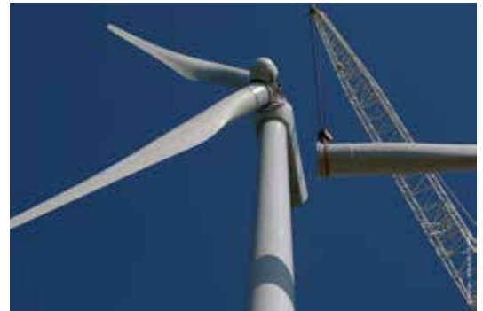
Parc éolien d'Arfons (81)

La construction de ce parc situé sur les communes de Saint-Saury et Sousceyrac a commencé en septembre dernier. Les accès et fondations sont terminés et attendent l'arrivée des éléments constituant les 7 éoliennes à partir du mois de mars. La production des premiers kilowattheures est prévue en juin !