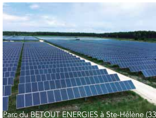
Parc du BETOUT ENERGIES à Ste-Hélène (33)

D'une puissance de 12 MWc, il devrait fournir 18 300 MWh/an, soit la consommation électrique de plus de 8 000 personnes (chauffage compris).