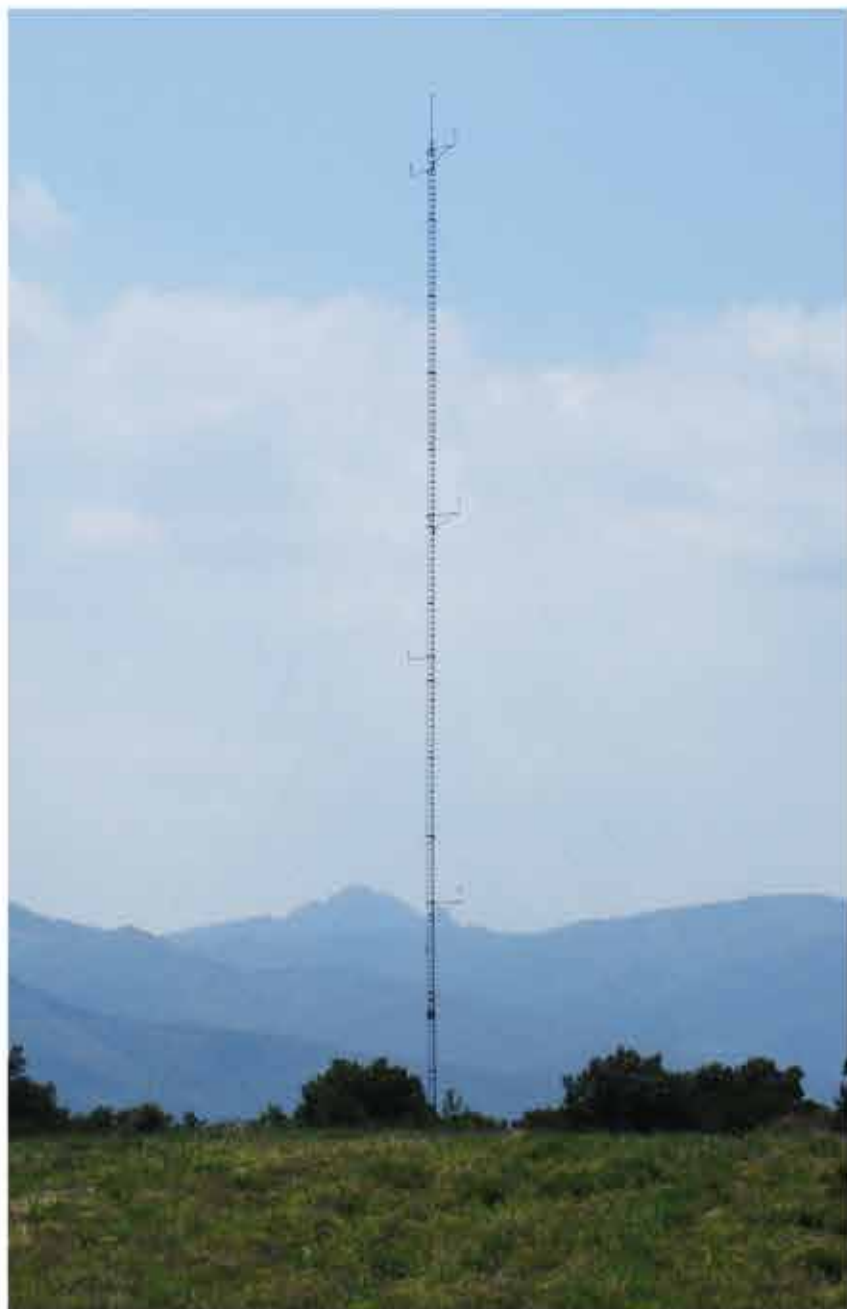
Mât de mesures de vent

Il propose ensuite des scénarios d'implantation intégrant au mieux les éoliennes à leur territoire.