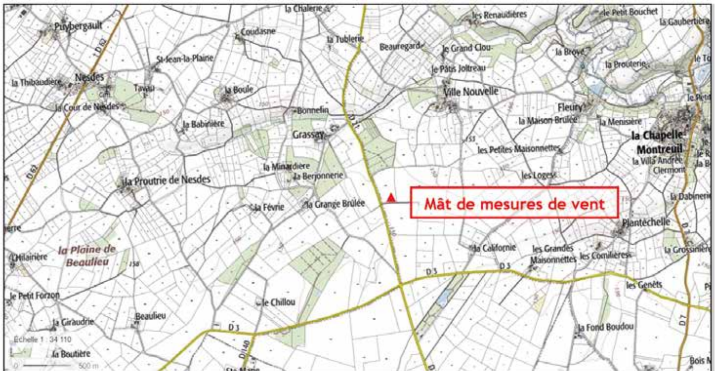
Emplacement du futur mât de mesures

Pour préparer le financement du projet, un mât de mesures va être installé à l'emplacement du futur parc éolien. D'une hauteur de 115 mètres, ce mât équipé d'anémomètres et de girouettes permettra d'obtenir des données de vent fiables à l'emplacement précis du futur parc sur une durée minimale d'un an.