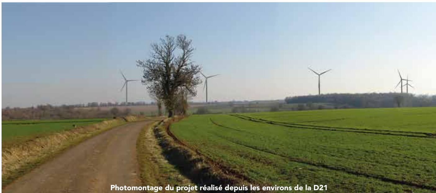
Photomontage du projet réalisé depuis les environs de la D21