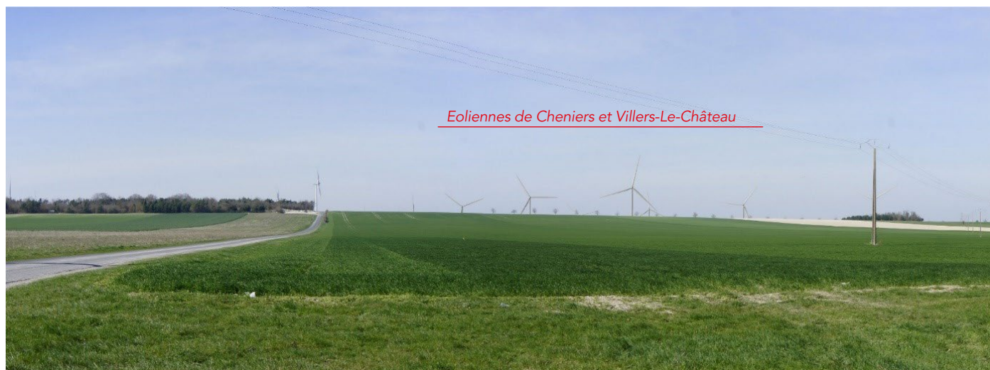
Cheniers - Photomontage depuis la voie communale menant à la route départementale : six éoliennes sont visibles

Le dossier d'étude d'impacts comportera une quarantaine de photomontages, répartis dans un périmètre de 20 km autour du projet. Réalisés depuis des points de vue emblématiques dont VALOREM a tenu compte pour choisir l'emplacement des éoliennes, ils permettent d'appréhender la lisibilité de l'implantation, son ancrage dans le site et les différents rapports d'échelle.