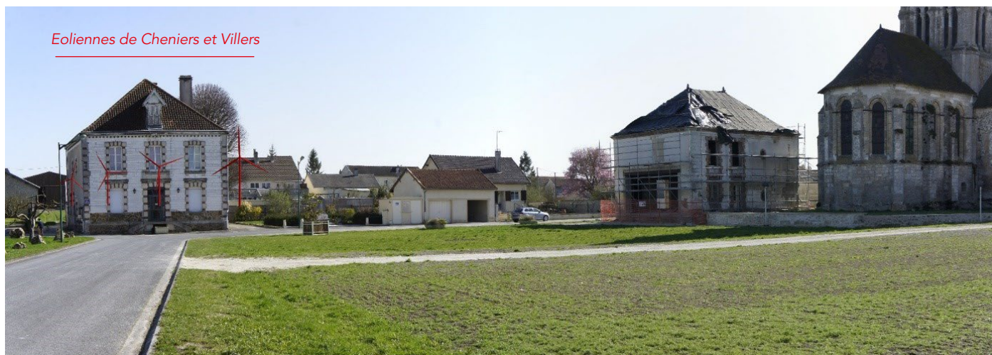
Thibie - Photomontage évaluant la covisibilité avec l'église Saint-Symphorien. Quatre éoliennes sont représentées en « filaire rouge » car en partie masquées par la mairie (Photo prise à l'été 2017, avant les travaux de la salle des fêtes).