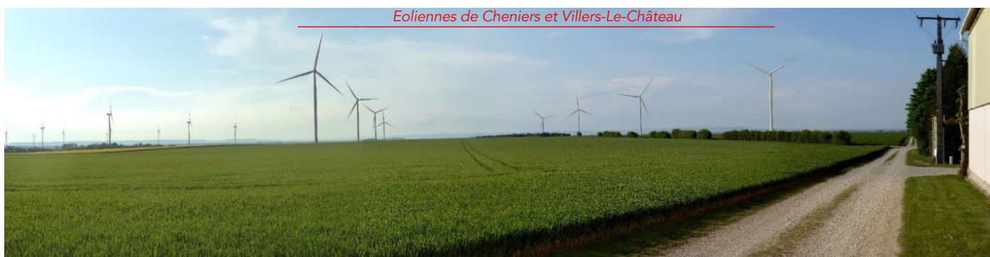
Depuis la ferme Notre-Dame, hameau le plus proche du projet