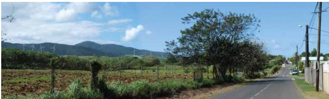
Simulation visuelle du projet éolien de Sainte-Rose