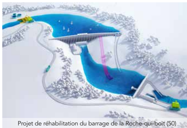
Projet de réhabilitation du barrage de la Roche-qui-boit (50)

VALOREM propose des solutions innovantes pour le passage des espèces piscicoles et des sédiments.