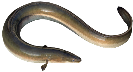
Le saumon et l'anguille, deux espèces protégées